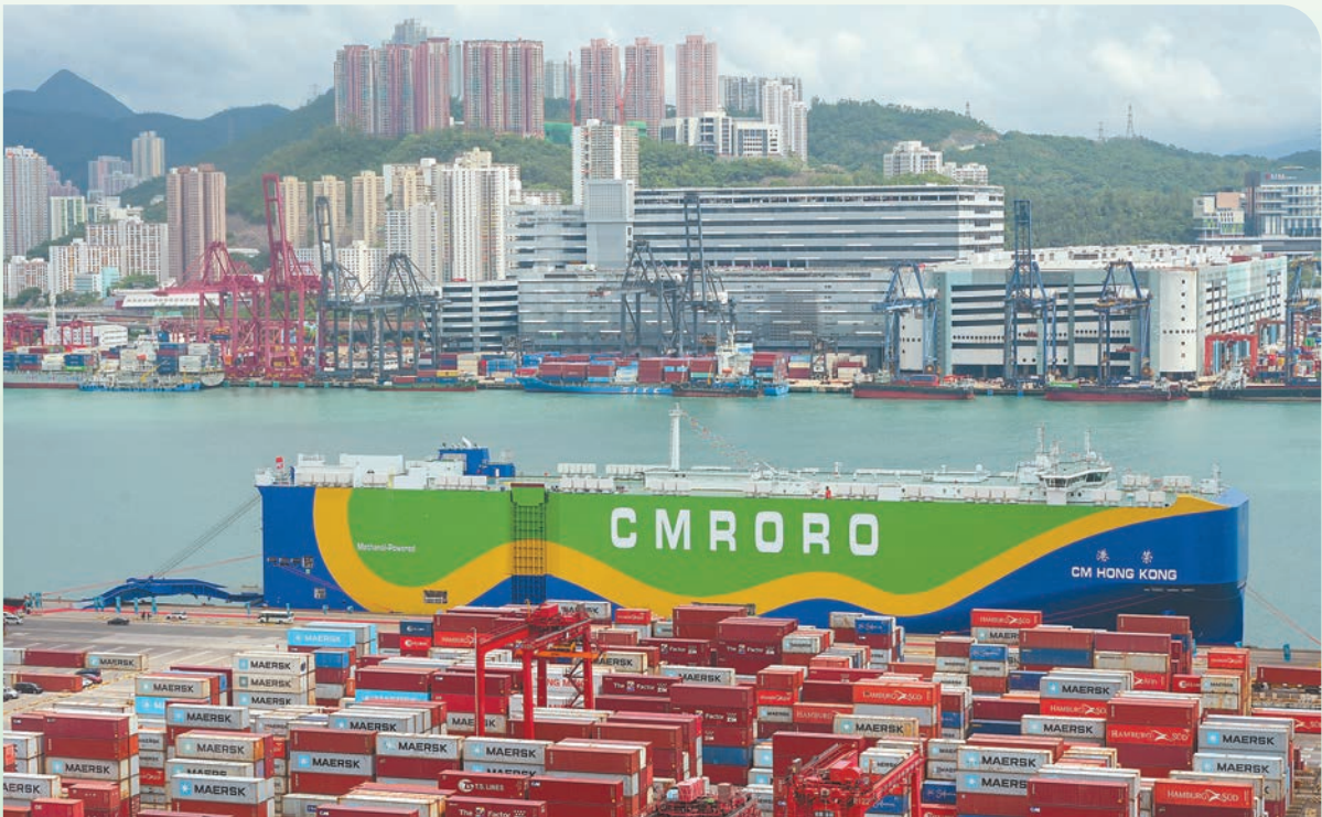
全球首艘甲醇雙燃料動力滾裝船「港榮」輪採用甲醇綠色燃料，成為同業先行示範。