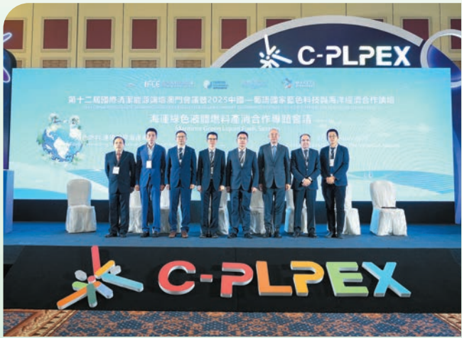
國際清潔能源論壇（IFCE）於「海運綠色液體燃料產消合作專題會議」發出成立「國際綠色燃料聯盟」倡議，引發廣泛共鳴與積極響應。

2025年10月16日 宣布對用於出航船舶的甲醇燃料實施免稅政策，進一步降低綠色燃料應用成本。香港成為亞太地區率先對綠色燃料提供稅收優惠的港口之一。