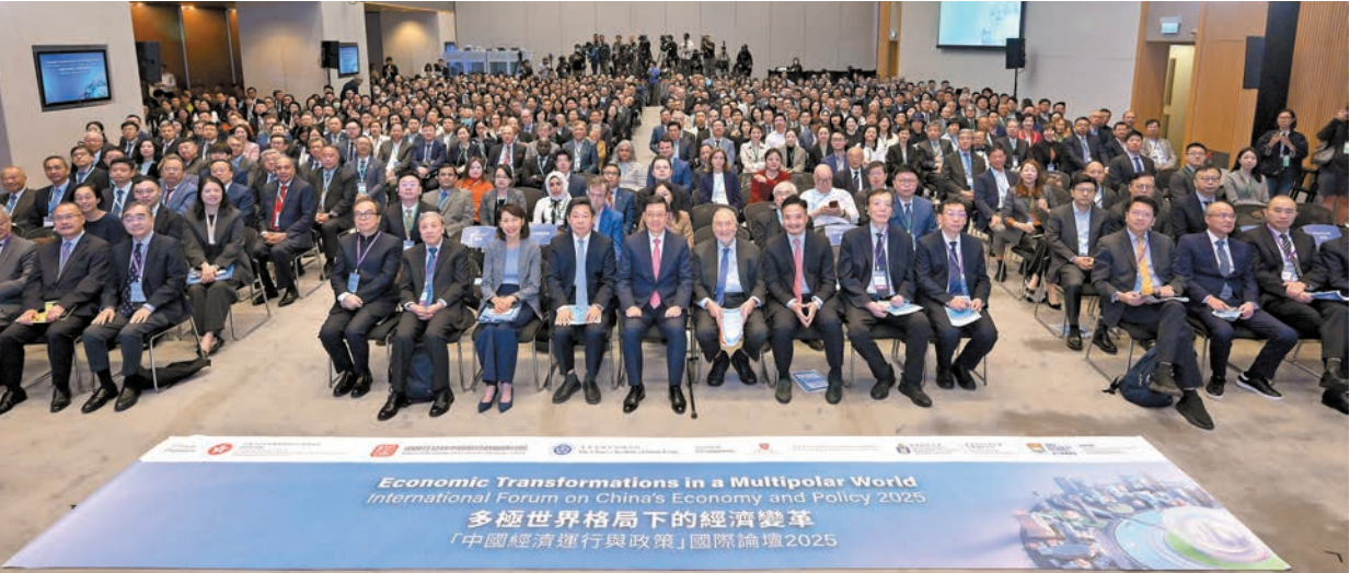
李家超昨日出席「中國經濟運行與政策」國際論壇。

就是投資光明未來，中國是動蕩世界中最大的穩定源和發展動力源。他說，「十五五」時期，香港要保持長期繁榮穩定，必須善用背靠祖國、聯通世界的獨特優勢，做好「超級聯繫人」以及「超級增值者」角色，並提升國家觀念及國際視野。香港須加強與內地特別是粵港澳大灣區的深度融合，推動更高水平的國際化，鞏固國際金融、航運及貿易中心地位，同時加快建設國際創新科技中心，更好協助國家高水平對外開放，持續成為多極世界中璀璨的東方明珠。