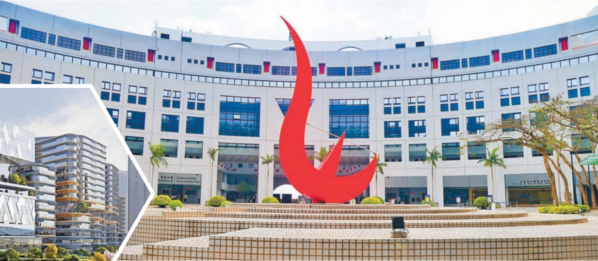
▲牛潭尾大學城內的綜合醫教研醫院模範圖。 ▲香港科技大學獲得籌備新醫學院工作組推薦承辦第三間醫學院。 立法會文件示意圖

政府於2024年施政報告提出設立第三間醫學院，並於牛潭尾預留土地發展醫學院校舍及新綜合醫教研醫院。及後，浸大、科大及理大三校均遞交