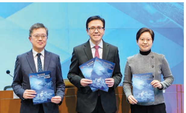
港府公布《新田科技城創科產業發展規劃概念綱要》。

節奏和相關收地和工務部門土地平整工程時間表，劃分為5個發展階段，從導入、產業生態延展、產城中樞，以至完善階段。在推展每一階段發展時，會以發展樞紐為統籌引領，發展其主要先進產業，並強調產城融合，除引進企業成立總部、打造商業綜合體外，並設有人才公寓空間，為創科人才提供各項城市配套。規劃亦結合實際情況，並預留一定發展彈性，提供戰略留白區，以在後續階段支援未來新興科技產業。 將設專屬公司與市場共同參與開發 就開發模式而言，按有為政府、高效市場原則，新田科技城的開發工作可考慮以成立專屬公司的模式與市場共同參與開發，利用市場化資源提升開發速度、優化開發成本。 根據顧問估算，新田科技城在完全運作階段預計每年將為香港本地生產總值帶來約2500億港元或以上貢獻，提供超過30萬個相關全職工作崗位。 由上述，新田新創科用地與河套香港園區將形成上中下游協同發展的重要紐帶，為本港創科產業提供辦公、原型、小試、中試、生產綜合空間的全鏈條配套支持。在國家「十四五」規劃及「十五五」規劃建議香港作為