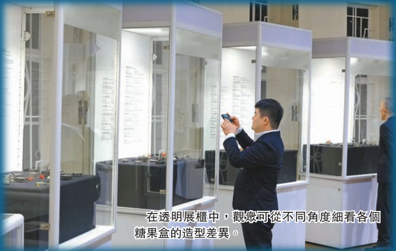
在透明展櫃中，觀眾可從不同角度細看各個糖果盒的造型差異。

趙之境的探索，恰似西西弗斯推石上山——每一次攀登，內涵與境界已然不同。他的價值，正體現在這永不停歇的攀登過程之中，及所開闢「融融共生」藝術新境。