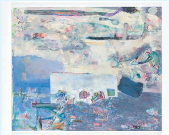
鄭婷婷作品《失物》，2025年。