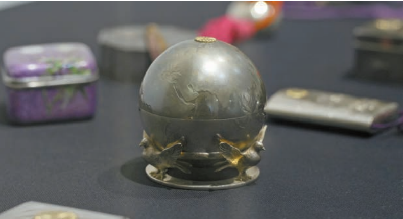
▲和平鴿托地球形糖果盒（金色御紋），1981年9月（大正10年），宮本商行製，東京。

日期：即日起至2026年2月8日 時間：星期二至星期六上午9時半至下午6時；星期日下午1時至6時；星期一、公眾及大學假期休息 地點：薄扶林般咸道90號 港大美術博物館馮平山樓2樓 門票：免費入場