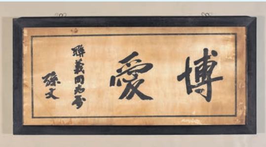
孫中山親書的「博愛」條幅，1920年。