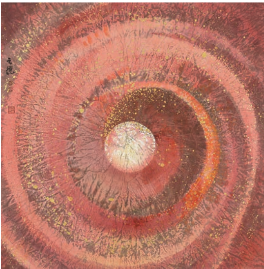
趙之境作品《逝者如斯夫》之二，2025年。

趙之境的藝術軌迹清晰可辨：地理上，從內蒙古至北京，終扎根香港；風格上，由北方寫實，經嶺