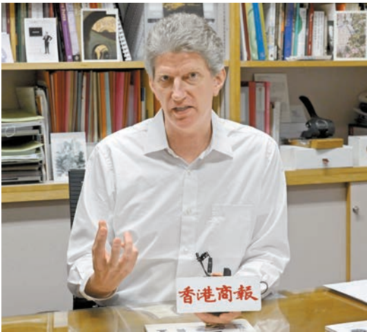
香港大學美術博物館總監羅諾德在專訪中談及糖果盒的製作商，這些作坊構成一條跨越多年、持續為皇室製作御製糖果盒的脈絡。