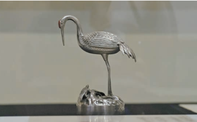
▲龜鶴紋橢圓形糖果盒，1894年3月9日（明治27年）。