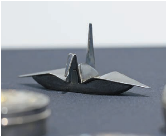
紙鶴形盒（中村家紋和桐紋），1920至1930年代初，錦綾堂，東京。