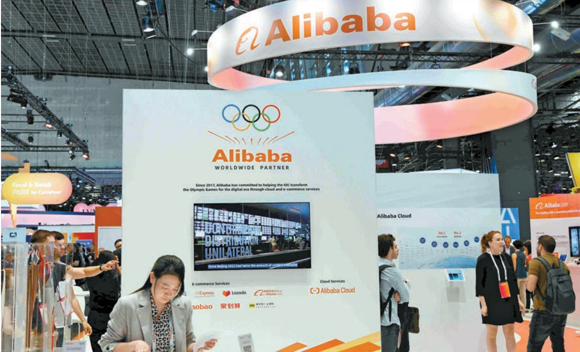
阿里巴巴第二財季經調整盈利按年跌72%至103.5億元，低過市場預期的135億元。

昨日，阿里巴巴股價全日續升2.1%，收報157.8元，成交額232.2億元，為全日成交最大個股。雖然阿里經調整盈利遜預期，但AI相關及雲業務表現佳。 當季，雲智能集團收入為398.2億元，按年升34%，主要由公共雲業務收入增長所帶動，其中包括AI相關產品採用量的提升，不計阿里巴巴併表業務的外部商業化收入增長29%。 阿里巴巴集團首席執行官吳泳銘表示，集團正處於投入階段，構建AI技術和基礎設施平台，以及生活服務與電商結合的大消費平台，創造長期戰略價值。集團在這些領域大力戰略投入，AI+雲、大消費