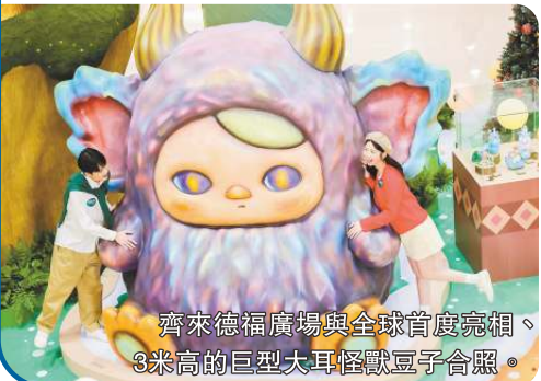
齊來德福廣場與全球首度亮相、3米高的巨型大耳怪獸豆子合照。

【香港商報訊】今年聖誕，德福廣場聯乘香港藝術家Pucky（畢奇）創作的小精靈，由即日起至明年1月4日，呈獻全港首個「Pucky聖誕奇幻森林」，把商場搖身變成木系夢幻森林，配合浪漫光影交織，營造出童話般的氛圍，絕對是今個冬日親子同遊、閨蜜聚會及情侶約會的打卡熱點。