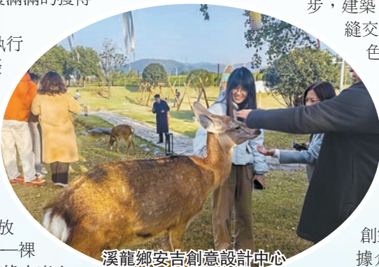
溪龍鄉安吉創意設計中心

眼下，5座修復後的礦山已身披綠裝，其礦坑化作澄澈深蓝湖泊，由127名大學生組成的創業團隊運營的礦坑咖啡，創下日銷8818杯的全國紀錄，長期霸榜抖音、小紅書「咖啡廳人氣榜」榜首，其「生態修復+青年創業+網紅運營」模式獲央視專題報道，相關實踐入選浙江省共同富裕最佳實踐名單。