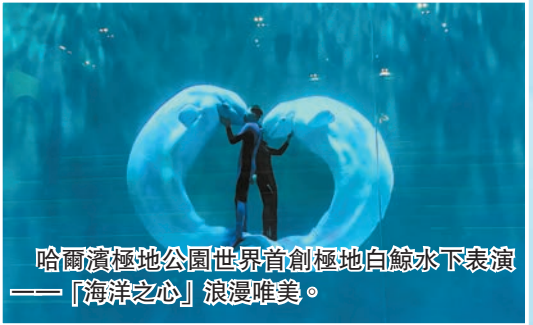
哈爾濱極地公園世界首創極地白鯨水下表演——「海洋之心」浪漫唯美。

文旅地標持續引爆熱度。在第38屆太陽島雪博會場外，耗時4天日夜趕工、耗費5000立方米雪量打造的巨型雪雕《雪人先生》成為今冬首個現象級文旅打卡點。這座於12月9日落成的雪雕高23.8米，較去年增高3.8米，以「愛，撒向八方」的美好寓意，吸引大批遊客駐足留影。