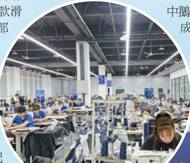
波司登（哈爾濱）智能製造公司生產車間一派繁忙。

作為專注冰雪運動裝備二十餘年的企業，除了高端競技裝備，乾卯雪龍持續深耕大眾市場與校園教育領域。其推出的基礎款滑雪板適配滑雪場出租及初學者，憑借低成本、低維修費用優勢深受青睞；借勢哈爾濱文旅熱度，開發的丁香花、城市景點等元素文創產品廣受關注，多款旅遊紀念品正加緊研發，初級滑雪裝備已批量供應各大滑雪場。 滑雪鞋賽道上，企業打造出國內首款滑雪場專用產品，通過優化材質與內部結構提升保暖耐磨性，單卡扣設計方便初學者穿脫；12月16日下線的高端專業滑雪鞋已赴長春參展，該鞋強度與防護性更優，售價較進口同類產品低超一半，核心部件自主研發且已申請專利。此外，公司聯合哈爾濱體育學院研發的新型基礎冰刀鞋，創新「三段式刃」設計並搭配高幫支撐結構，規避了傳統冰刀易摔倒、易崙腳等缺陷，已應用於哈爾濱體育學院、哈工大等院校基礎滑冰教學。