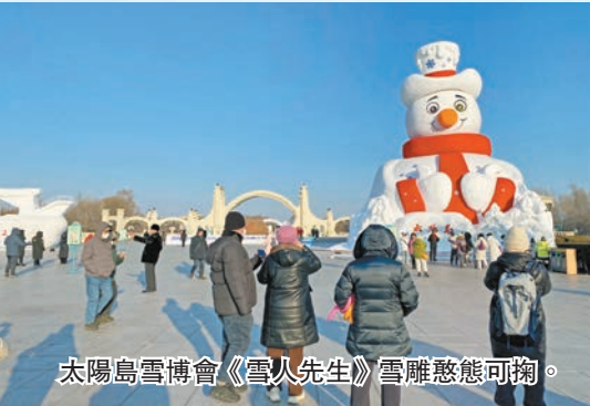
太陽島雪博會《雪人先生》雪雕憨態可掬。

現代冰雪運動的發源地」，並明確指出「冰雪文化和冰雪經濟正在成為哈爾濱高質量發展的新動能和對外開放的新紐帶」。循着總書記的指引方向，今冬的「爾濱」，這座承載着中國冰雪運動初心與夢想的城市，正以開放包容的胸懷、銳意進取的姿態，驚艷世界，書寫屬於自己的新冰雪傳奇。 記者 張曉磊