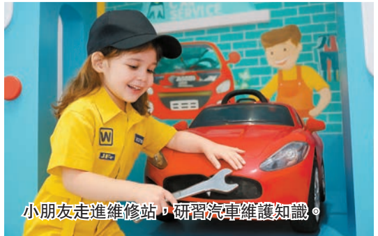
小朋友走進維修站，研習汽車維修知識。

挪亞方舟度假酒店坐擁180度青馬大橋及沙灘海景，設有多間奇趣滿Fun的主題客房，其中「星宇漫遊主題客房」科幻感十足，房間設計滿載浩瀚宇宙元素。酒店豐盛閣餐廳於指定日子推出「繽紛復活節海鮮自助餐」，食客可飽覽青馬大橋的醉人海景，同時品嚐多款環球美饌，持有挪亞方舟當日門票可享八折優惠。