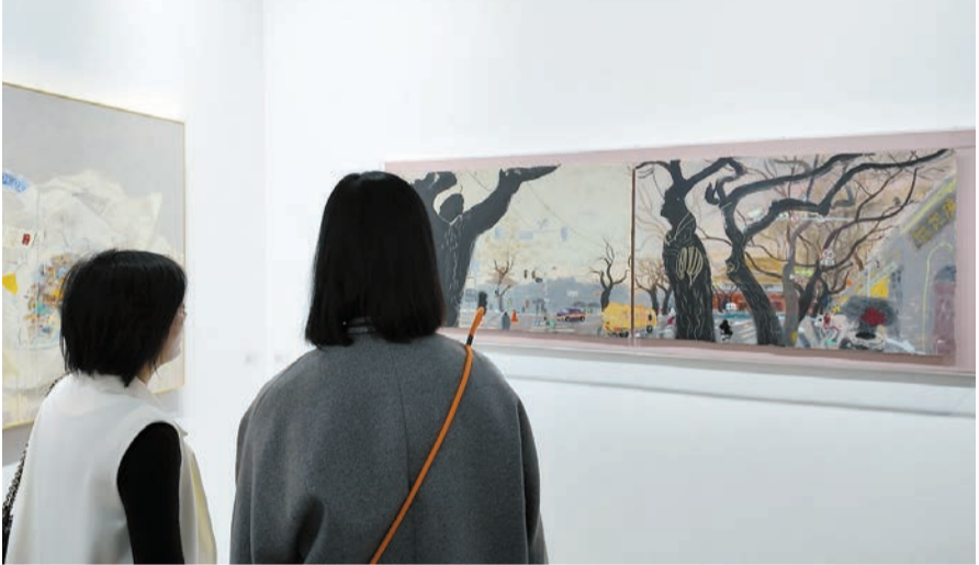
參觀者在王玉平《東華門殘雪》前停留細看。