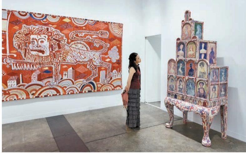
觀眾駐足於藝術家Grayson Perry作品前，左側為其掛毯創作《Sacred Tribal Artefact》(2023年)。