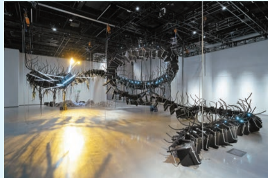
展品《我們小心養大的獸》將辦公椅懸吊於空中，向展廳深處延伸。

Landmark South地下高層展藝館 內容：人工智能與人類關係的急速演變，從最初的機械操作、程式運算，以至逐步滲入情感與心理層面，它的存在早已流滄於日常。隨人工智能與人類的互動越趨密切，彼此的界線逐漸被稀釋，現正舉辦的展覽「稀釋成透明」以辦公室的家具與設備為素材，挪用並重組成大型的藝術裝置，回應場地的空間特性，創造出一個漂浮於虛構與現實邊界的異托邦世界。在這個「世界」中，人工智能悄然改寫工作的面貌，人不再站於中心，與一種正在形成的新秩序交織共存。如展廳中央的大型動態雕塑《我們小心養大的獸》，由層層堆疊並重新組裝的辦公椅構成，懸吊於空中，向展廳深處延伸，如同一具盤踞半空的修長機械生物，彷彿從「以人為本」到「依循機器自身邏輯」的緩慢變形。展覽邀請觀眾漫步其中，在既熟悉又陌生的空間中穿梭，感受人與科技彼此糾纏、相互生成的微妙狀態。 記者：怡