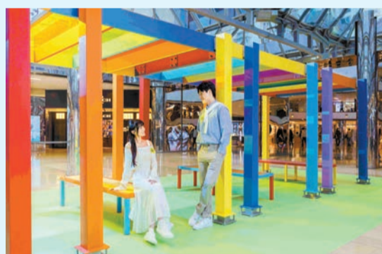
觀者可坐於Liam Gillick作品《Perpetual Discussion Platforms》歇息，感受悠閒時刻。

內容：香港三月藝術氛圍濃厚，就連商場都可欣賞到藝術品的蹤影。「城市藝術客廳」以「IN ART WE SHARE」為主題，透過曾亮相於2025年巴塞爾藝術展香港展會的英國藝術家Liam Gillick大型裝置《Perpetual Discussion Platforms》為核心，延伸出三個互聯空間，分別為「LET'S SEE歡朋滿座」公共藝術交流平台、「LET'S INSPIRE靈感站台」多領域藝術文本展現及「LET'S SHARE音樂導航」現場音樂體驗，建構流動的人文互動交流。這件裝置曾在2025年巴塞爾藝術展香港展會亮相，在玻璃天幕映照下，彩色大型模組高架平台配合相應的透明頂蓋和座椅在陽光折射下綻放斑斕五彩光影，具像化呈現作品匯聚的多元文化與思想交流的精神內涵。不妨在繁忙日常之中，以藝術、音樂、文化啟迪出藝文節奏。 記者：怡