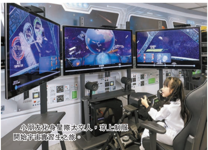
小朋友化身星際太空人，穿上制服開始宇宙實習生之旅。

主題公園裏同時設有適合小朋友盡情探索的各式玩樂體驗，如由地球極速衝上宇宙的「衝天太空艙」、可讓小朋友享受自駕腳踏高卡車的「童趣飛