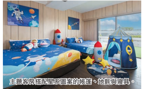
主題客房搭配星系圖案的帳篷、地氈與寢具。