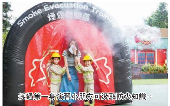
透過第一身演習小朋友可汲取防火知識。