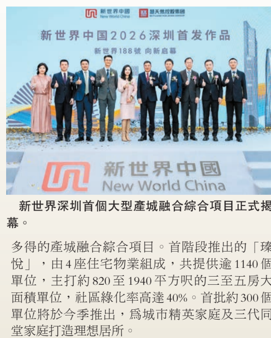
新世界中國2026深圳首發作品 新世界188號 向新啟幕

作為集團參與深圳城市建設的最新力作，新揭幕的新世界188號總建築面積約970萬平方呎，涵蓋逾230萬平方呎商務辦公空間、超過10座住宅物業，並設有特色商店街、幼兒園、綜合健康服務中心、文化活動中心及大型地下停車場，構建完善多元的生活圈。項目毗鄰地鐵3號線永湖站，是目前深圳東部規模領先、不可