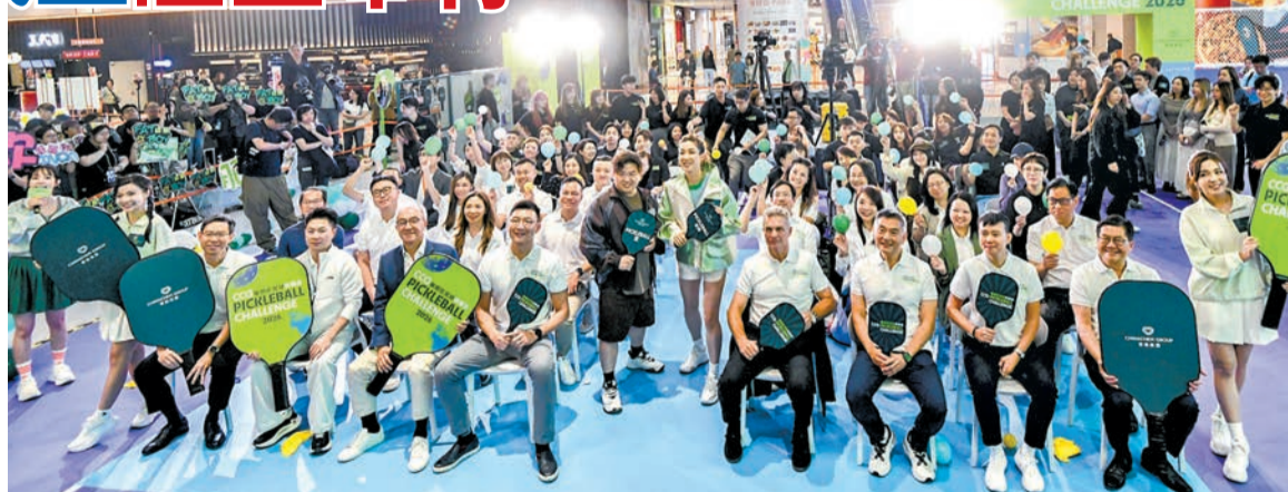
全港商場最大型匹克球賽「華懋匹克球挑戰盃2026」及免費「匹克球嘉年華」，即日起至12日在室內四場同步舉行。

為激勵球手爭取佳績，公開組男、女子單打冠軍球手將贏得總值港幣12000元的四天馬來西亞匹克球交流之旅，與當地頂尖球手切磋，並接受認證教練的特別