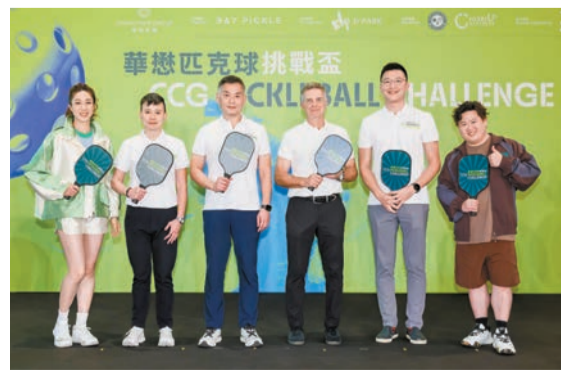
「開幕禮暨名人邀請賽」，眾嘉賓為十日賽事揭開序幕。

訓。SKECHERS亦為各組別勝者送出總值超過港幣27萬元的禮券及獎品，長榮航空特別送出亞洲來回機票予公開組三個雙打冠軍。所有賽事收益扣除成