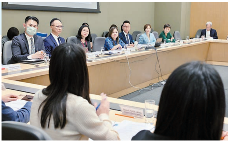
文化體育及旅遊局昨日召開會議，統籌內地勞動節黃金週旅客訪港預備工作，與各單位代表討論迎接訪港旅客安排。

【香港商報訊】記者馮仁樂報道：文化體育及旅遊局昨日召開會議，統籌一連五日內地勞動節黃金週(5月1日至5日)接待訪港旅客的預備工作。