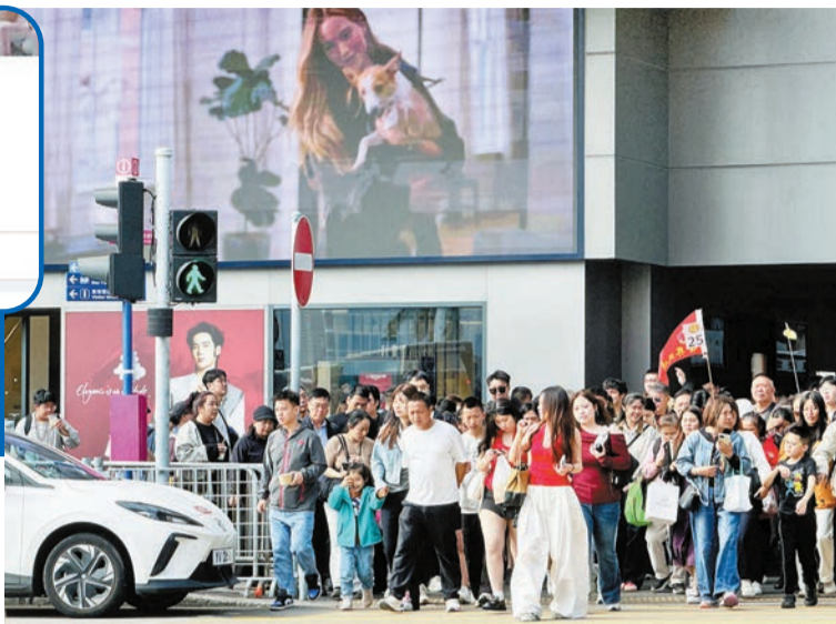
旅監局早前主動調查發現，日月星旅行社有限公司於2026年1月至3月期間接待有關內地入境旅行團時威迫購物。