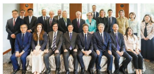
李家超聯同多名司局長，與歐盟駐港外交官午餐，就經濟和發展等議題交換意見。