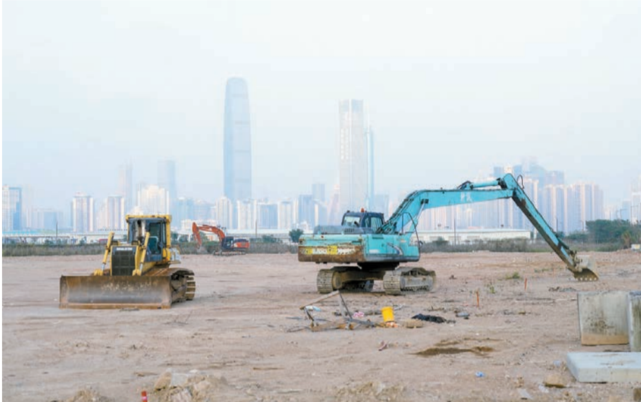
發展局局長甯漢豪表示，北都9個新發展區當中4個的土地平整和基建工程已如火如荼進行。圖為港深創科園土地平整區。

【香港商報訊】記者萬家成報道：立法會財委會昨日舉行特別會議，多名政策局局長與會作簡報。其中，發展局局長甯漢豪表示，在2026/27年度規劃地政科及其轄下部門的開支預算總額，約為77億6100萬元，與去年相若。她並談及北部都會區（北都）最新發展狀況，指土地平整等工程正進行得如火如荼。另外，地政總署亦指已啟動程序徵用兩幅土地興建北環線主線。