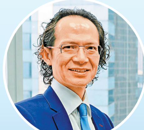
史理生認為，各地航運公司可趁 當前局勢利用香港作融資平台。

他相信，隨着港府加強金融基建，如近日發出穩定幣發行人牌照，將給予資金更多選擇，吸引更多資金來港投資。