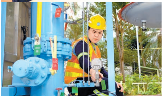
由室內爐具檢測到戶外管網巡查，Towngas工程團隊憑專業技術標準，嚴格把關每個細節。