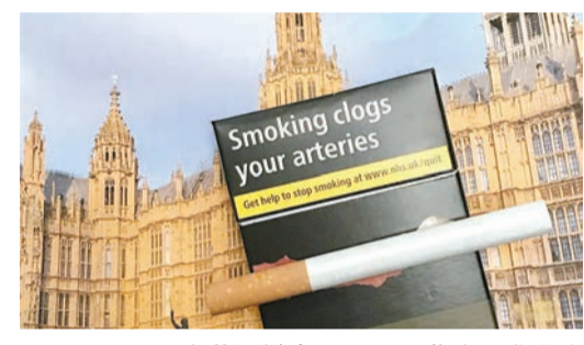
反吸煙分子在英國議會展示吸煙導致心臟病的標語。

2022年，新西蘭成為首個頒布此類法律的國家，同樣禁止向2008年以後出生的人群銷售香煙；但實施不到一年，該法在政府換屆後被廢除。2025年11月，馬爾代夫宣布禁止向2007年1月1日之後出生的人群銷售香煙。