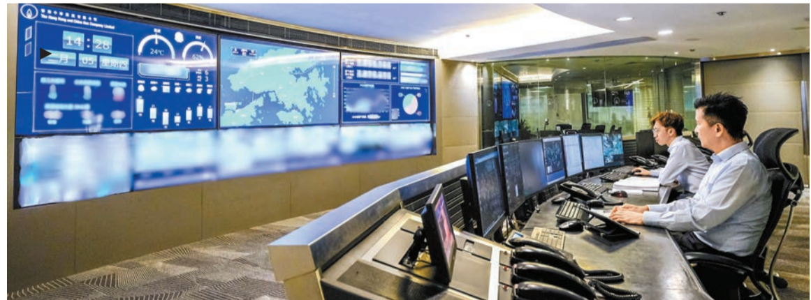
燃氣網絡調度中心24小時監察全港供氣情况。