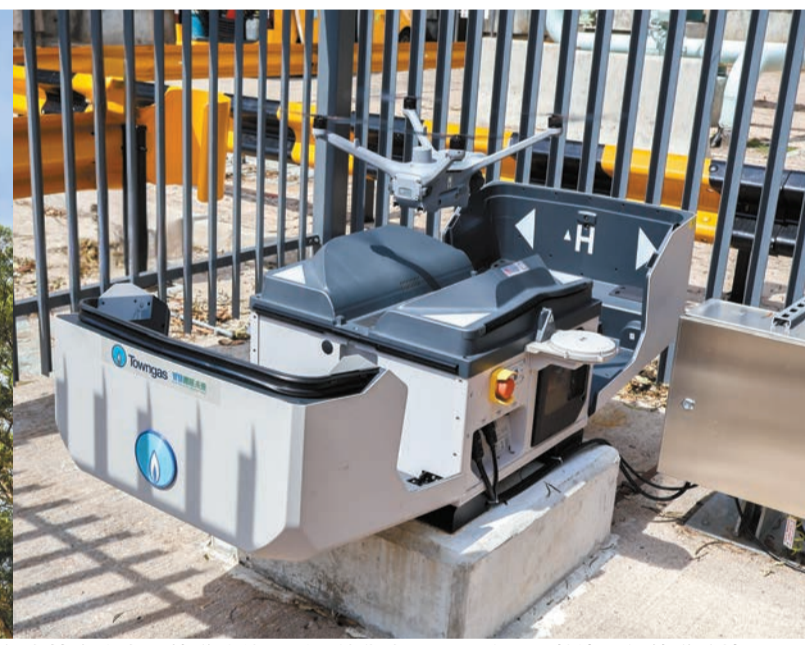
管道巡檢無人機在空中沿管道路線監測，技術人員可即時透過數據了解管道的情况。