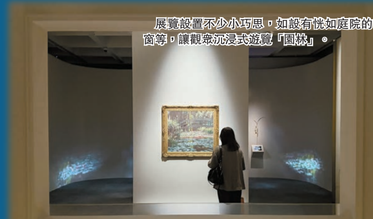
展覽設置不少小意思，如設有恍如庭院的窗等，讓觀眾沉浸式遊覽「園林」。

不論是中國傳統文人舉辦「曲水流觴」的雅趣，還是西方繪畫大師筆下的睡蓮、花園景觀，都是在園林以及草木疊石間寄託對理想生活的想像。香港藝術館全新大型展覽「園美生活——中外園林藝術」，首度匯聚北京故宮博物院、美國芝加哥藝術博物館、法國凡爾賽宮及藝術館館藏逾百件珍品，以「造園」、「遊園」和「賞園」三重意境，帶觀眾走進帝王、文人與藝術大師的「精神家園」，感受如何在有限的空間裏，疊山理水，移天縮地，築起桃花源。記者、部分圖片：Janice