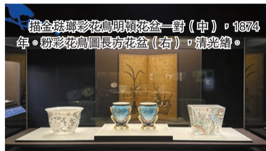
描金玻璃彩花鳥明頓花盆一對（中），1874年。粉彩花鳥圖長方形花盆（右），清光緒。

園林之妙，不僅在於花草亭台，更在於它如何成為心境的延伸。清代宮廷畫家冷枚的《避暑山莊圖》，描繪了中國現存最大的皇家園林河北承德避暑山莊，據汪元介紹，畫家繪畫康熙年間的避暑山莊，與現時略有不同，「畫作風格寫實，精細嚴謹，以鳥瞰視角、糅合青綠山水與西洋透視法，增加了畫面縱深感。左下角為皇帝處理政務的場所，現時規模更大。」汪元指，展品是皇家園林以園載道的藝術典範，展現了「雖由人作，宛自天開」的造園理念。畫作原貯於北京紫禁城養心殿，方便乾隆皇帝在處理政務之時「移天縮地在君懷」，皇家園林不僅是帝王休憩的後花園，還是統御四海、治理國家的政治工具與精神寄託。此外，展覽帶來沉浸式體驗，以科技重新演繹經典的曲水流觴雅集場景，觀眾可透過與羽觴酒杯「互動」，細賞紫花綻放的美態。從遊覽清宮御苑、凡爾賽花園，再到大師打造的園林，展覽最終都在引領觀眾尋找心中那處可棲居的桃花源。