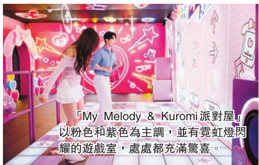
「My Melody & Kuromi 派對屋」以粉色和紫色為主調，並有霓虹燈閃耀的遊戲室，處處都充滿驚喜。

動裝置。每晚的特別版「光影盛夜」匯演亦將融入Sanrio角色元素，為日間探險畫上璀璨句號。