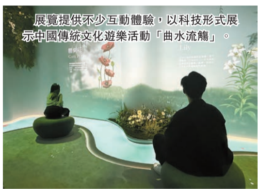
展覽提供不少互動體驗，以科技形式展示中國傳統文化遊樂活動「曲水流觴」。