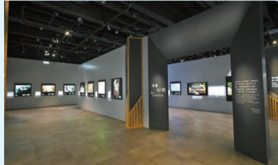
展覽多幅攝影作品展示自然之美的時候讓人反思保護環境的重要性。

日期：即日起至9月2日 時間：星期一、二、三及五上午10時至晚上7時；星期六、日及公眾假期上午10時至晚上9時 地點：九龍尖沙咀東部科學館道二號香港科學館地下特備展覽廳 門票：港幣20元（成人票，全日制學生免費） 內容：有否覺得今年的夏天來得格外早，不少人已經開冷氣。氣溫年年攀升，不只是數字上的紀錄，更是自然發出的微弱警號。現正舉辦的展覽「野外生態攝影年展」藉着展示來自全球不同地方、震撼人心的影像和拍攝對象背後的故事，以獨特的角度展現大自然的真貌，讓觀眾更感同身受。展品為倫敦自然歷史博物館舉辦的2025年度「野外生態攝影大賽」的得獎照片，這項逾六十年歷史的賽事，去年吸引了113個國家和地區、超過六萬幅參賽作品。在展覽能看人類活動如何導致棲息地破碎化與全球暖化等問題，如比賽的總冠軍、來自南非的Wim van den Heever的作品——「鬼鎮訪客」，是攝影師用了十年時間，終於在一個荒廢城鎮中拍攝到罕見的棕鬃狗，讓人反思人類與大自然的關係，喚醒大眾保育物種與守護環境的意識。 記者：怡