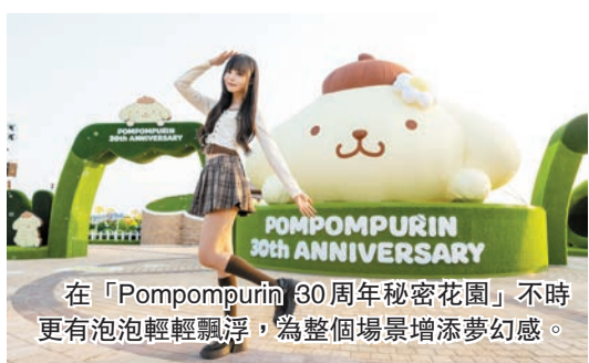
在「Pompompurin 30周年秘密花園」不時更有泡泡輕輕飄浮，為整個場景增添夢幻感。