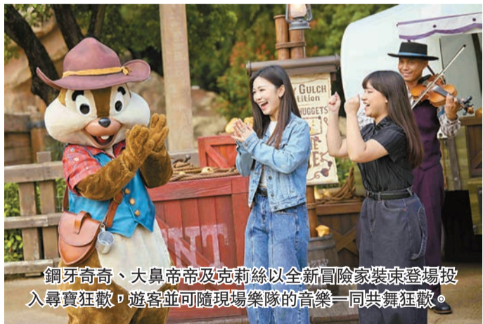
鋼牙奇奇、大鼻帝帝及克莉絲以全新冒險家裝束登場投入尋寶狂歡，遊客並可隨現場樂隊的高樂一同共舞狂歡。

香港兩大主題樂園——香港迪士尼樂園與海洋公園分別推出全新互動體驗，展開夢幻童話之旅。迪士尼樂園推出灰熊山谷冒險之旅，並於5月上旬迎來可自由走動的《魔雪奇緣》角色雪人小白，海洋公園則邀請Sanrio人氣角色布甸狗慶祝出道30周年，為市民提供多元的假日休閒選擇，遊客也可趁五一小長假遊玩一番。 記者：Janice