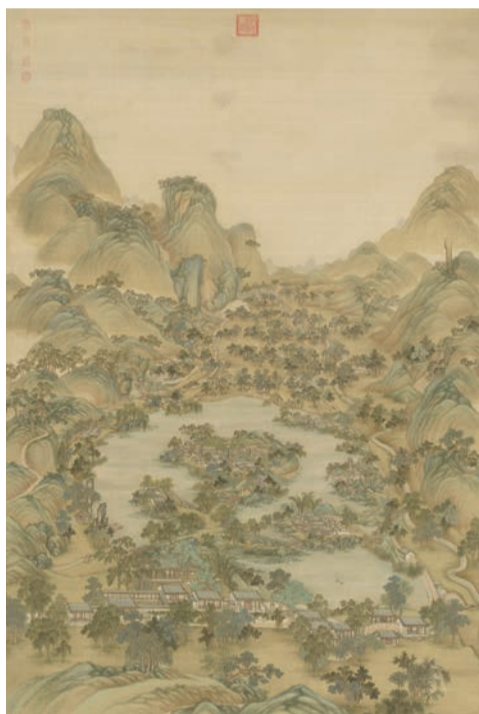
冷枚作品《避暑山莊圖》，清代。