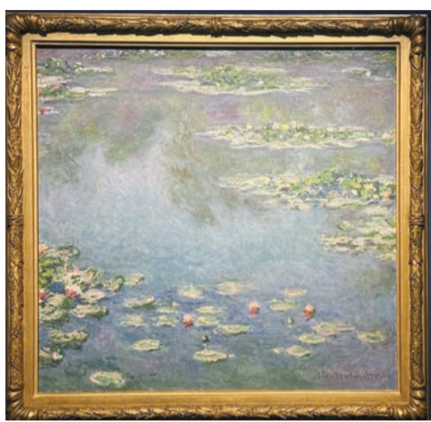
克勞德·莫奈作品《睡蓮》，1906年。

日期：即日起7月29日 時間：星期一至三、五上午10時至下午6時；周末及公眾假期上午10時至晚上9時 地點：九龍尖沙咀梳士巴利道10號香港藝術館2樓專題廳 票價：免費