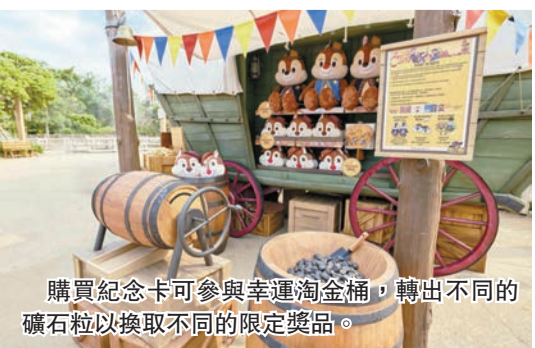
購買紀念卡可參與幸運淘金桶，轉出不同的礦石粒以換取不同的限定獎品。

5月上旬，位於魔雪奇緣世界的阿德爾森林，將首次出現一位「會走路」的雪人——小白。華特迪士尼幻想工程運用強化學習科技的新一代機械人技