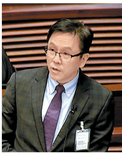
孫東稱，特區政府具備清晰且連貫的創科產業政策。

在民間層面，亦不斷有企業落力推動創科發展。昨日，香港科技園公司與 Google 香港共同宣布啟動第二屆「人工智能（AI）孵化計劃」，今屆計劃合共有 16 間具發展潛力的初創企業獲選參與，數目較上屆增逾一倍。入選企業涵蓋數碼商業、金融科技、保險科技、媒體、醫療健康、建築科技及可持續發展等多個領域，展現 AI 跨行業的廣泛應用潛力。在投資推廣署支持下，本屆計劃首度有 3 間海外初創企業參與，為海外企業拓展市場提供平台。