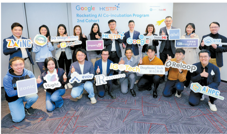
第二屆「人工智能孵化計劃」昨舉辦啟動禮。