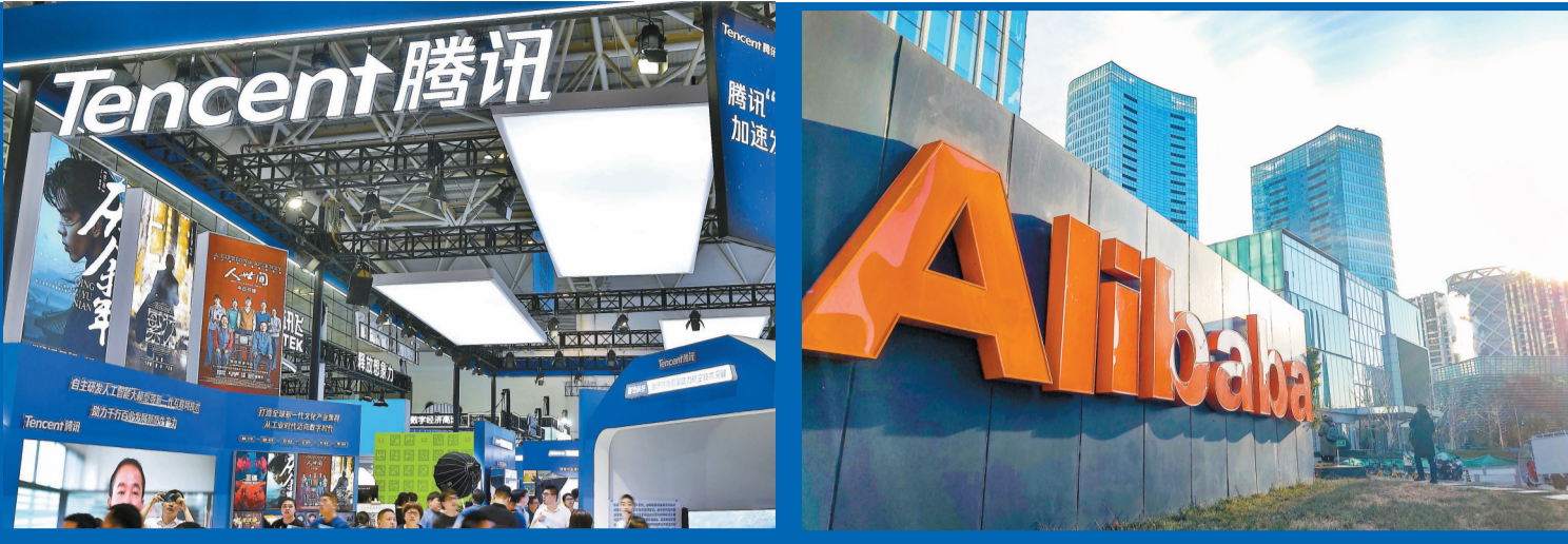
騰訊及阿里巴巴昨公布業績，兩科技巨頭不約而同都在AI發展上着墨不少。

【香港商報訊】記者鍾俠報導：昨日，兩大科技巨頭騰訊（700）和阿里巴巴（9988）不約而同發布業績報告，均提及在開關 AI 戰線時取得長足發展。