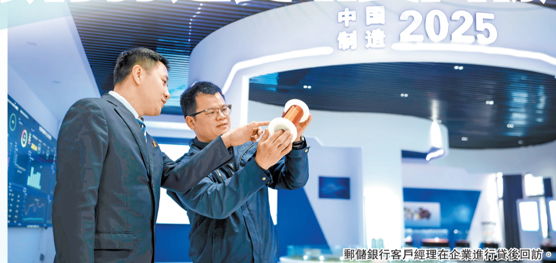
郵儲銀行客戶經理在企業進行貸後回訪。

2026年是「十五五」的開局之年，銀行業普遍面臨息差收窄、優質資產稀缺的雙重壓力。然而郵儲銀行交出了一份「逆周期」的成績單：一季度貸款增速5%，位居六大行首位；代表轉型成色的中收勁增16.83%。