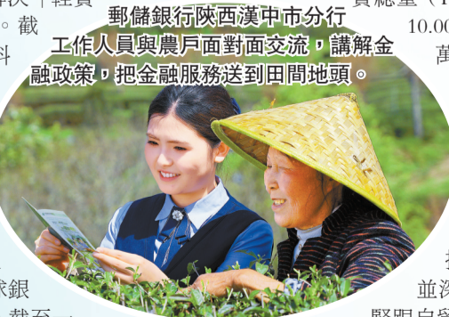
郵儲銀行陝西漢中市分行工作人員與農戶面對面交流，講解金融政策，把金融服務送到田間地頭。