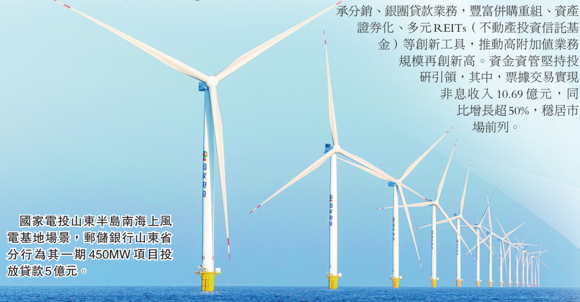
國家電投山東半島海上風電基地場景，郵儲銀行山東省分行為其一期450MW項目投放貸款5億元。

今年3月20日，郵儲銀行全資子公司中郵金融資產投資有限公司正式開業運營。行長蘆葦在年度業績發布會上稱，會將其打造成為投貸聯動創新平台、科技創新長期資本平台、結構性改革債轉股平台和股權投資管理平台，構建起「股、貸、債、投」一體化的綜合金融服務生態。