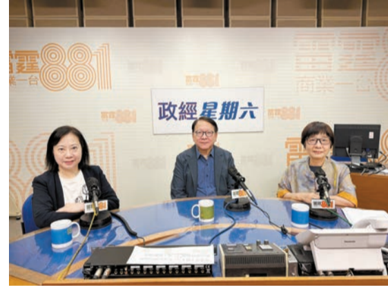
陳國基（中）表示，北都大學城有3幅片區，其中洪水橋新發展區土地最快完成平整，即將招標。

陳國基指出，發展北都大學城除了注重創科外，亦希望與企業和產業合作，相信可吸引更多企業落戶香港，增加投資及本地就業機會。他亦期望未來大學城可以與海內外的知名大學和科研機構合作，例如合辦交換生計劃促進文化交流，開拓學生的國際視野。