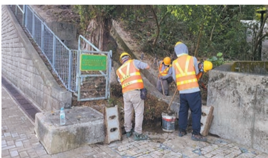
路政署同事清理斜坡，為颱風季節做好準備。

【香港商報訊】記者萬家成報道：颱風季即將來臨，運輸及物流局局長陳美寶昨在網誌撰文，已指示路政署為極端天氣做好預備，採取一系列預防措施，加強應對惡劣天氣準備的能力。