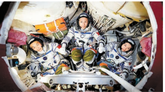
官方發布神舟二十三號航天員乘組訓練圖片，圖右為本港首名航天員黎家盈。

保安局局長鄧炳強出席另一個電台節目時表示，對有警務人員能成為航天員感到榮幸及興奮，當看到黎家盈透過鏡頭用廣東話向公眾打招呼時特別感動。他透露，黎家盈由警隊借調到保安局進行技術工作，他在工作上有機會接觸黎家盈，形容對方很有毅力，相信是當航天員一個很重要的特質。他相信，黎家盈的經歷對年輕人亦是一個很大的啟發，希望黎家盈日後有機會向香港青少年、甚至警隊人員分享經歷。