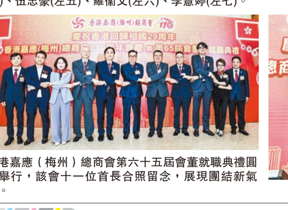
香港嘉應(梅州)總商會第六十五屆會董會就職典禮圓滿舉行，該會十一位首長合照留念，展現團結新氣象。