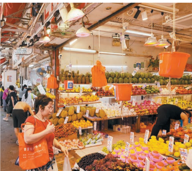
政府統計處公布，2026年5月份整體消費物價同比上升2%，基本通脹率為1.9%。